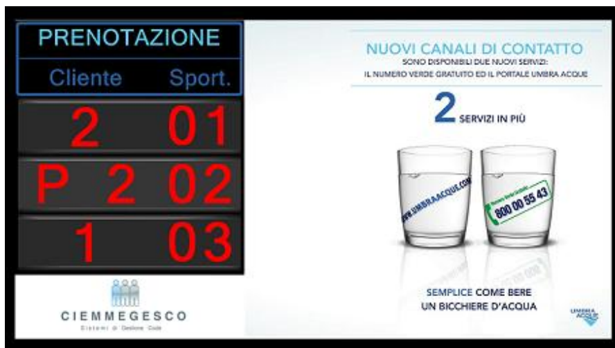
Visualizzazione delle ultime Tre Chiamate + "Digital Signage" su Monitor LCD 42" "RIEPILOGATIVO"