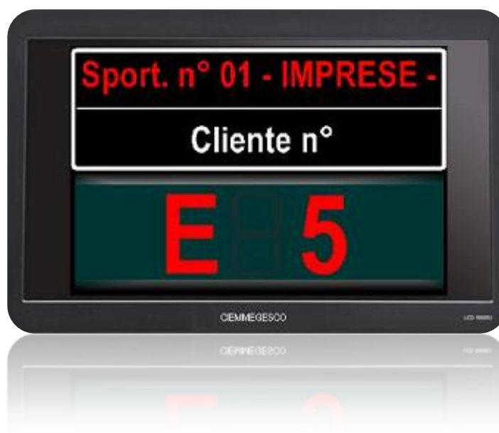
Visualizzazione del Numero Chiamato su Monitor LCD 19" "POSTAZIONE DI SPORTELLO"