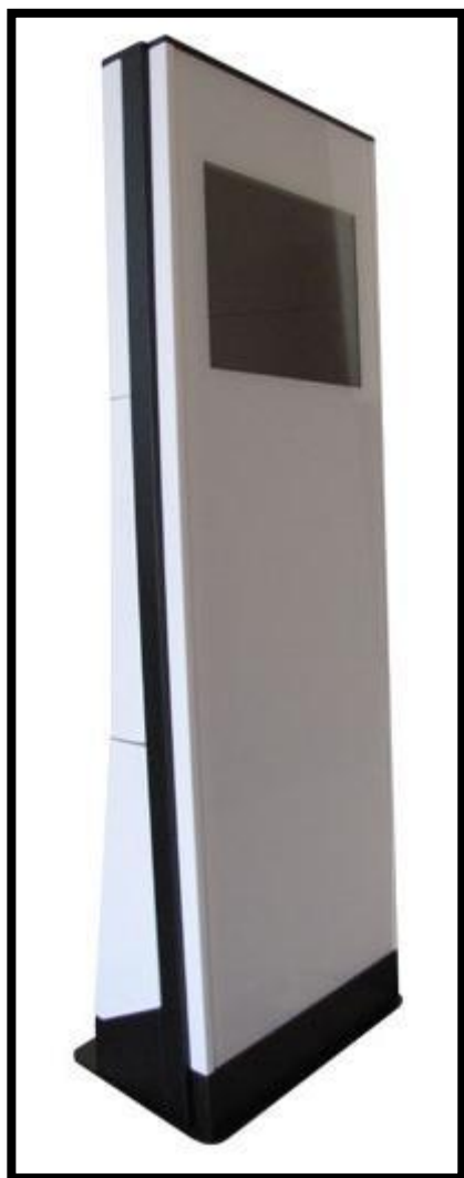
Distributore di Biglietti "TOUCH -SCREEN"